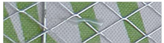
SPラスとHP防水シートは ホットメルト止め

メタルラスとカ骨がクラックを最小限に防止します。 また、 耐アルカリネット をモルタルに伏せ込むことによりヘアークラックを最小限に防止します