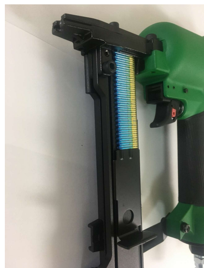
・ステープル装てん時